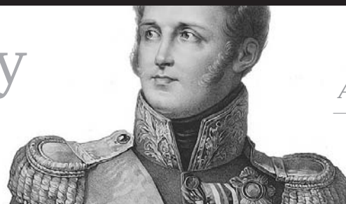
Император Александр I